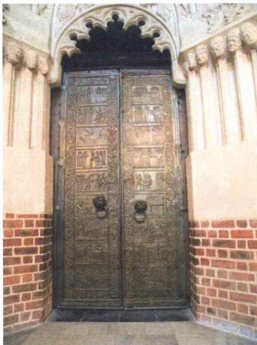
Ilustracja 3. (lub Zdjęcie 2.) Jonathan Edwards.

A handwritten signature in blue ink, appearing to be 'WJ' or similar, located in the bottom right corner of the page.